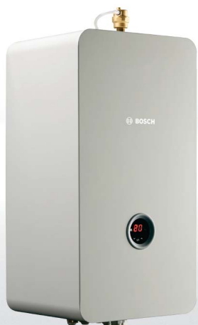
Tronic Heat 3000/3500

Разом з Tronic Heat 3000 або 3500 ви вибираєте конструкцію з найкращих матеріалів та прива-